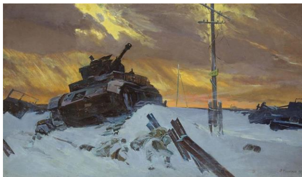
Враг остановлен Усыпенко Ф.П