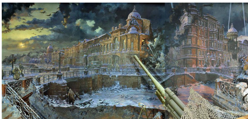
Диорама Блокада Ленинграда Корнеев Е.А.